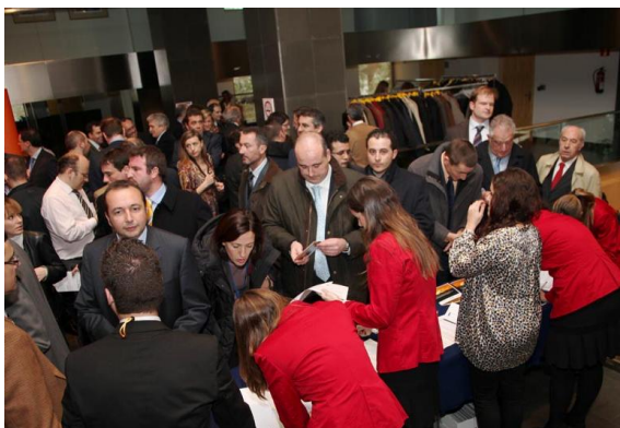
Zona de recepción de asistentes

Bajo el título “Espacio Empresarial 2012: la nueva configuración de los mercados y la respuesta del sector logístico”, el pasado 25 de febrero de 2010 se celebró en el Auditorio de Mutua Madrileña el X Encuentro del Club Logístico LÓGICA, que se centró en la crisis económica y en la necesidad de cambio de la industria para adaptarse a las nuevas circunstancias. Los ponentes coincidieron en su enfoque positivo sobre la actual situación y apostaron por la formación, la reforma laboral y la internacionalización. Por su parte, Gonzalo Sanz, presidente de LÓGICA, instó al sector a reaccionar a través de la autocrítica y del liderazgo empresarial, para impulsar el cambio desde dentro e identificó los cuatro retos a los que se enfrenta la industria.